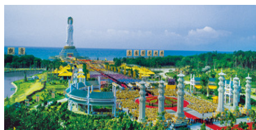
Nanshan Guanyin's Statue